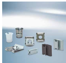
Schnellbefestiger und Clipse