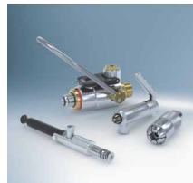
Schnelladapter und -kupplungen 2)