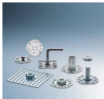
Befestigungselemente für Verbundwerkstoffe